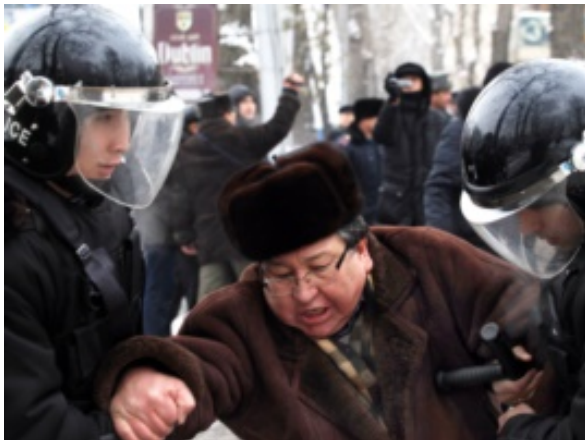
Момент предыдущего ареста оппозиционного политика Серику Сапаргали во время митинга. Алматы, 17 декабря 2011 года.

Адвокаты подследственных — каждый на своем