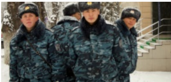
Группа военнослужащих возле Алмалинского районного суда. Алматы, 19 марта 2012 года.

пропагандирующих социальную рознь, причинены тяжкие последствия в виде массовых беспорядков 16 декабря 2011 года на площади Независимости города Жанаозен, совершённых участниками незаконной акции, сопровождавшихся насилием, погромами, поджогами и разрушением административных и других зданий, уничтожением имущества, человеческими жертвами среди населения, а также применением насилия, опасного для жизни или здоровья в отношении представителей власти».