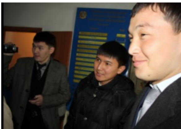
Группа людей в штатском, отслеживающих поведение присутствующих в фойе здания Алмалинского районного суда. Алматы, 19 марта 2012 года.