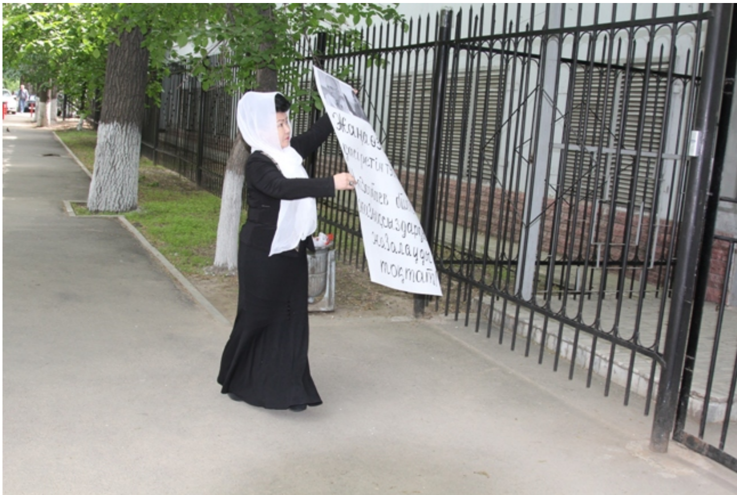
На плакате Айсұлу написала: «Назарбаевская власть, породившая беспорядки в Жанаозене, прекрати наказывать безвинных людей!».